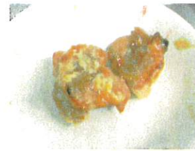
※ 塩麴で「やわらかい! 子どもたちに人気の肉のレシピです!」