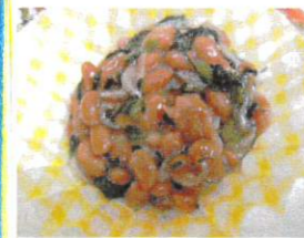
子どもたちに人気のメニューです!